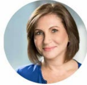
ד"ר יעל אלמוג זכאי מייסדת קפיטליזם קשוב ישראל ויו"ר לשעבר, אשת עסקים